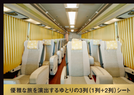
優雅な旅を演出するゆとりの3列(1列+2列)シート