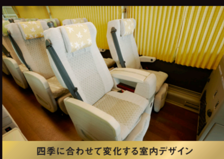
四季に合わせて変化する室内デザイン

こだわりの内装に、ゆとりの3列シートを備えた、新型デラックスバス「エンペラー」を、「きわみ」専用車としてご用意しました。「エンペラー」とともに、厳選された日本の美しい景色をめぐり、美食を堪能する、ワンランク上の旅を、あなたに。