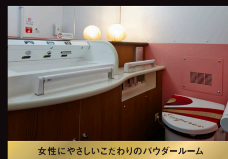
女性にやさしいこだわりのパウダールーム