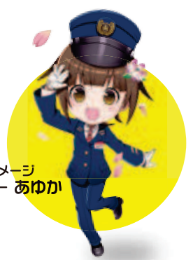
岐阜バスイメージキャラクター あゆか