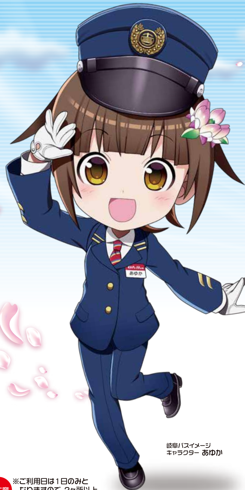
岐阜バスイメージ キャラクター あゆか