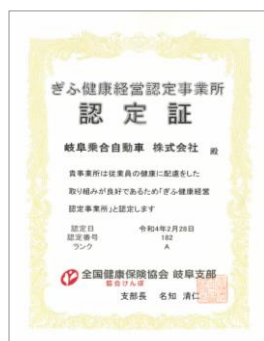
▲協会けんぽ岐阜支部「ぎふ健康経営認定事業所」（認定R4.2.28）