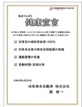
▲協会けんぽ岐阜支部「健康宣言」（登録R5.6.20）