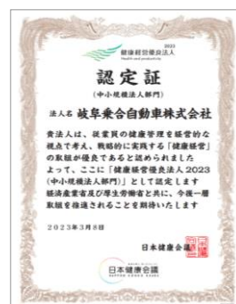
▲経済産業省「健康経営優良法人2023(中小法人部門)」（認定R5.3.8）