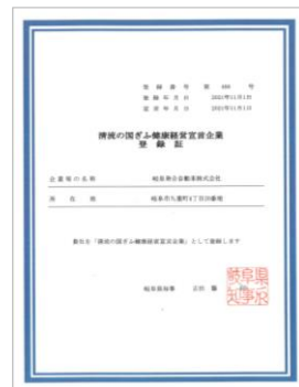
▲岐阜県「清流の国ぎふ健康経営宣言」（登録R3.11.1）