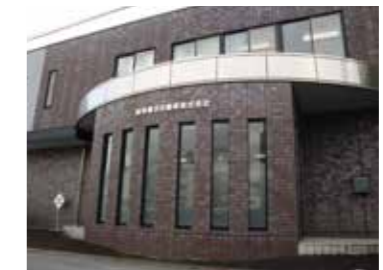
名鉄新岐阜ビルより本社を九重町へ