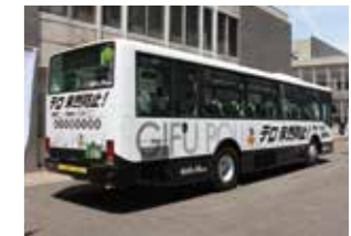
パトカー仕様ラッピングバス

5 岐阜県警連携のパトカー仕様ラッピングバスのお披露目 9 ハロウィンラッピングバスのお披露目 バスフェスタ2016(メディアコスモス)に参加