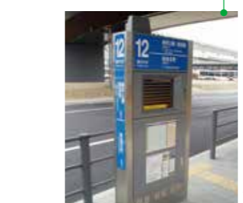
バスの位置情報や到達予測時間が分かるようになった