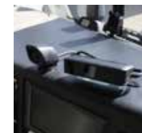
ドライバーステータスマネーター