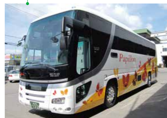
女性を意識したデザインに一新