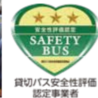
貸切バス安全性評価認定事業者

12 貸切バス事業者安全性評価認定「★★★(三ツ星)」を取得(平成27年に引き続き) 「あいちITSワールド2017」に連節バスを出展 名古屋モーターショー(ポートメッセなごや)同時開催の 「あいちITSワールド2017」に連節バスを出展