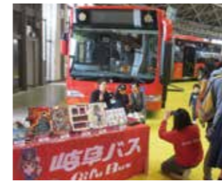
名古屋モーターショー