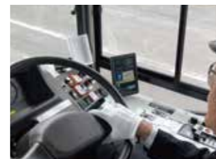
新運行支援システム「LIVU」