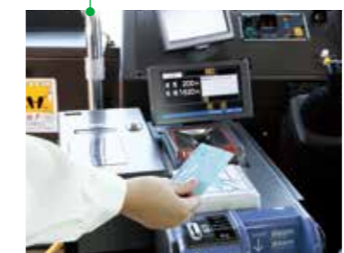
東海3県のバス会社で最初に導入