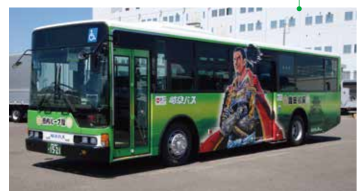
ぎふ清流国体を機に、市内ループ線で運行をスタートした