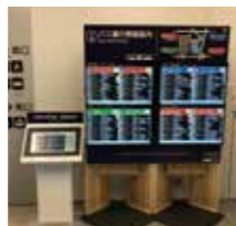
バスロケーションシステム・運行情報案内板