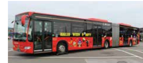
ハロウィンラッピングバス

11 「第1回トランジットモール実証実験」に参加 岐阜バス観光(株)と岐阜バスコミュニティを吸収合併