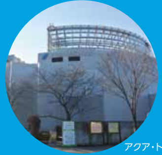
アクア・トトぎふ